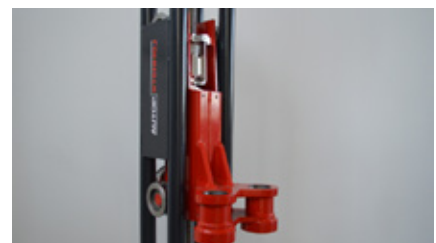
Chariot sur rouleaux