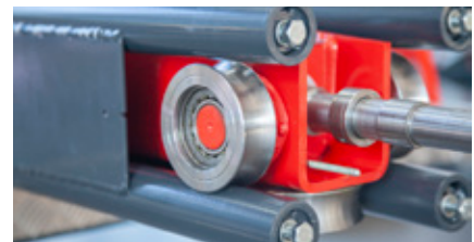
Colonne soudée avec chariot sur rouleaux