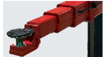
Des bras pivotants triple-télescopiques avec structure de levage F