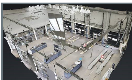
Mercedes Beresa in Münster, Deutschland