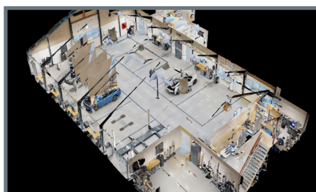
KOED Aarhus Nord A/S, Dänemark