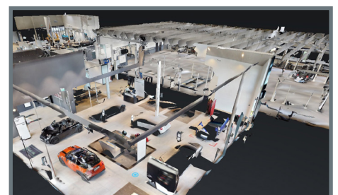
BMW Märtin in Freiburg, Deutschland