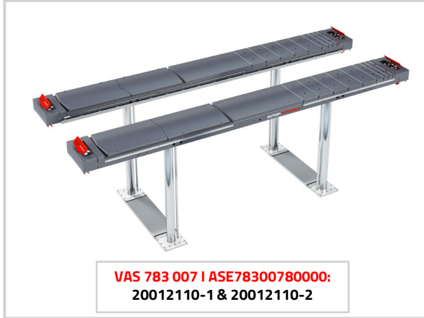
VAS 783 007 | ASE78300780000: 20012110-1 & 20012110-2

Elektrohydraulische 4-Stempel-Hebebühne 6,5 t mit Fahrbahnlastaufnahme