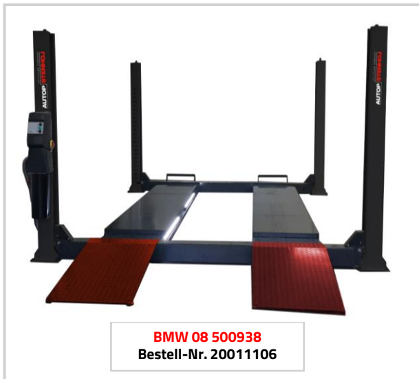
BMW 08 500938 Bestell-Nr. 20011106