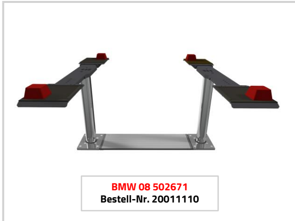
BMW 08 502671 Bestell-Nr. 20011110